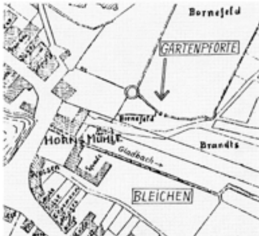
Situation an der ehemaligen Horn's Mühle mit den Bleichwiesen am Gladbach, wohin die Bleicher Zutritt durch eine Gartenpforte hatten, welche der Abt ausdrücklich zugestanden hat